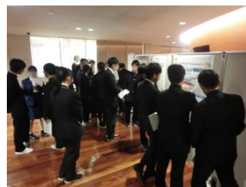
令和元年度高校生チャレンジの様子

発表内容については、電気化学に関わる物理、化学、生物、地学等を含む、広範囲な自然科学・技術分野を対象とします。下記にキーワード(順不同)と発表研究テーマの例を示しますので、発表申込の際に参考にしてください。